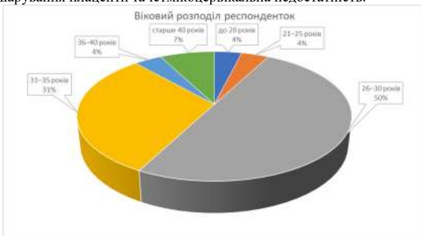
Рис. 1. Віковий розподіл респонденток

Респондентки були віком від 17 до 44 років, при чому половина з них (50 %) знаходяться у віковому діапазоні 26–30 років (Рис. 1) та значна кількість (42,31 %) народили менше ніж 6 місяців тому. У 27 опитаних жінок (13,23 %) спостерігалися ускладнення під час пологів, в тому числі обвиття пуповини, гіпоксія плоду та наявність передчасних пологів. У 8 респонденток (3,85 %) під час вагітності спостерігалася відшарування плаценти та істмікоцервікальна недостатність.