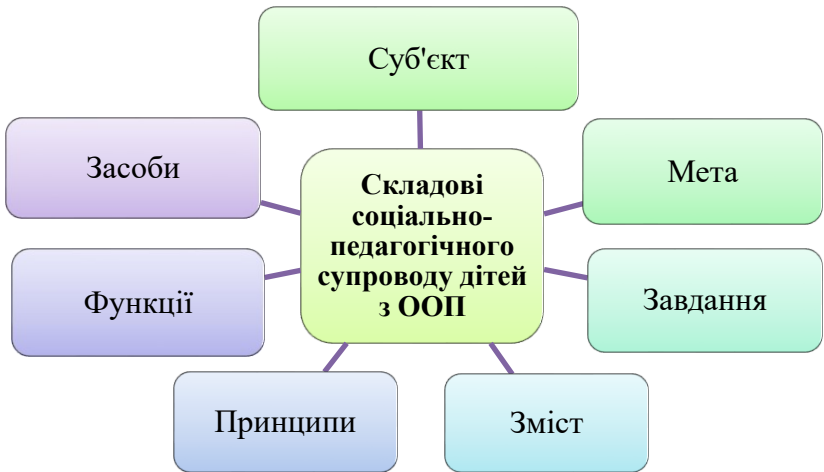
Рис. 2.1. Складові соціально-педагогічного супроводу дітей з ООП